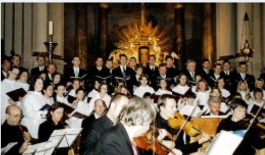
Weihnachtsoratorium von J. S. Bach