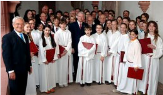
Kloster Eberbach (mit Michael Gorbatschow und Ministerpräsident Roland Koch)